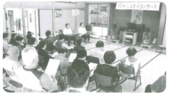
清寿会と合同レコードコンサート