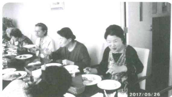
ホテルレストランでの会食”おいしいね、