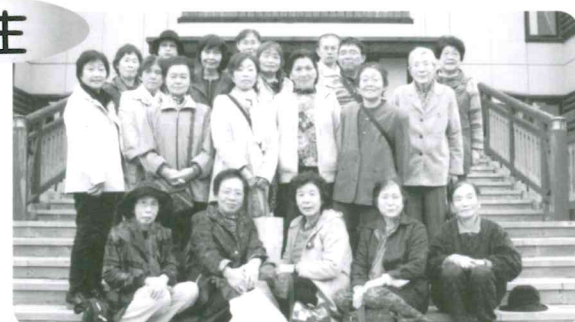
ホテル金山ハイムで食事の後ひと風呂浴びる