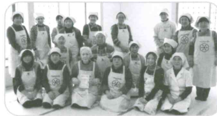
食生活改善 宅配弁当ありがとう!