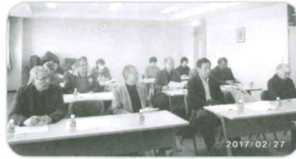
役員研修会 清幸園

(収入) (支出) (29年度へ繰越) 769,132円 - 458,963円 = 310,169円