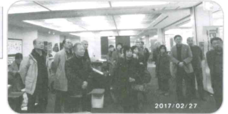
役員研修会 天童木工見学