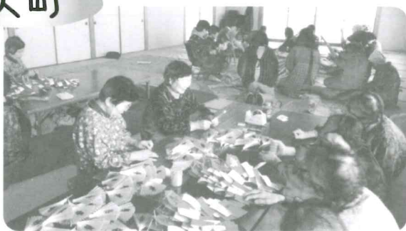
恒例行事の一つとして年末に「しめ飾り」を全員で作り町内の各家庭に販売しています