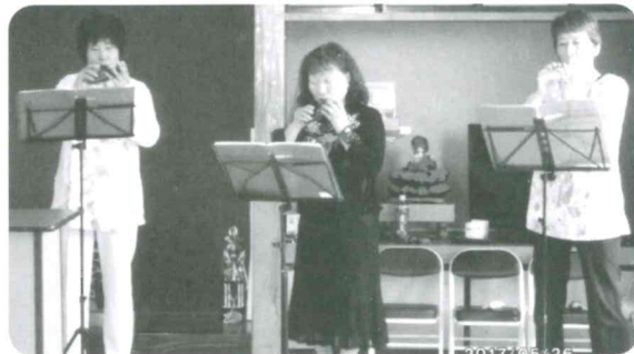
手品とオカリナを楽しむ