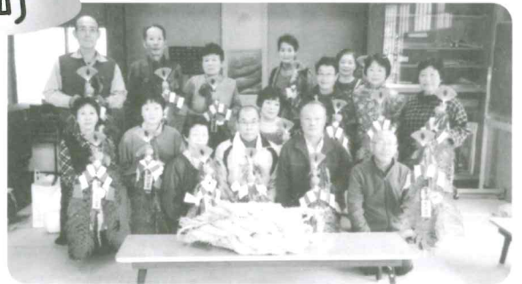
一8年前からずーと続いているゆ縄飾りづくり一いなり様に奉納するゆ縄作りとゆ縄飾りづくりの準備を一緒にしています ゆ縄飾りづくりみんな慣れたものでみんなが先生で楽しく、良き年を迎えられるよう祈りを込めつくっています